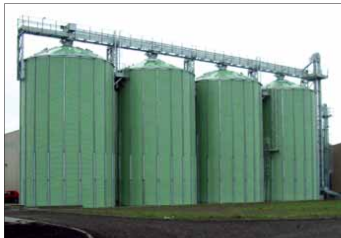
Ecopark Harlingen Holding bv is de trotse eigenaar van een gloednieuwe koolzaadolie molen, gefinancierd door Triodos Groenfonds.

Kortom, de positieve resultaten door de rentebetaling van de beleggingen aan het fonds werden in 2006 helaas overschaduwed door de kapitaalmarktrentestijging. Even-